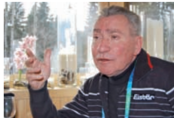
Für Vizepräsident Schauer darf Spitzensport nicht zum Selbstzweck werden. Die Förderung des Breitensports ist für ihn ein ganz wichtiger gesellschaftlicher Auftrag

Paul Schauer: Die olympische Bewegung muss die Menschlichkeit in den Vordergrund stellen. Es gilt diese Werte zu leben und das ist auch immer wieder geschehen. So ist eine österreichische Schwimmstaffel bei den Spielen in Berlin 1936 aus Protest nicht angetreten und wurde gesperrt. Mein Vorgänger Othmar Brix hat diese Sperre 2001 symbolisch aufgehoben. Das ist der olympischen Idee würdig, auf Seite von Sportlern und Funktionären. ❁