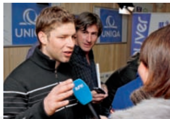
Benni Raich im Interesse nationaler und internationaler Medien