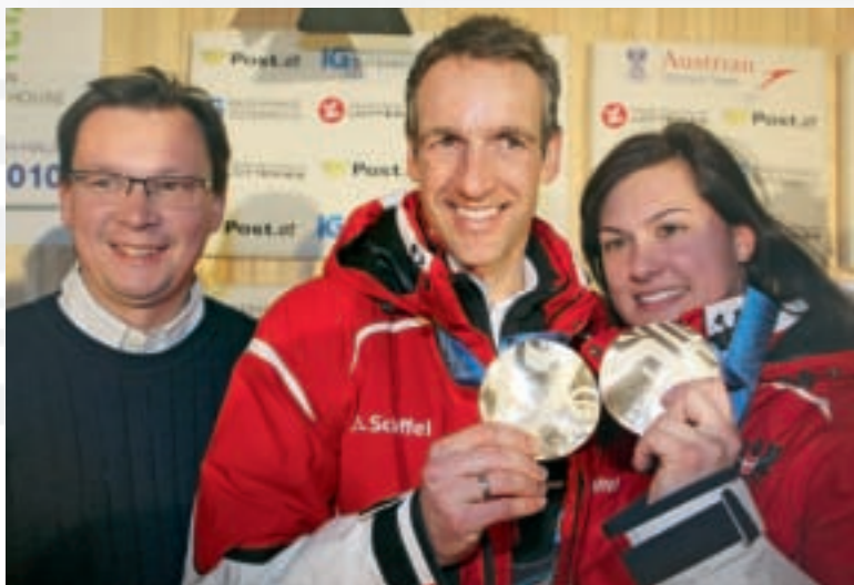
Bundesminister und Sporthilfe-Präsident Norbert Darabos freute sich über die Medaillengewinner Christoph Sumann und Nina Reithmayer